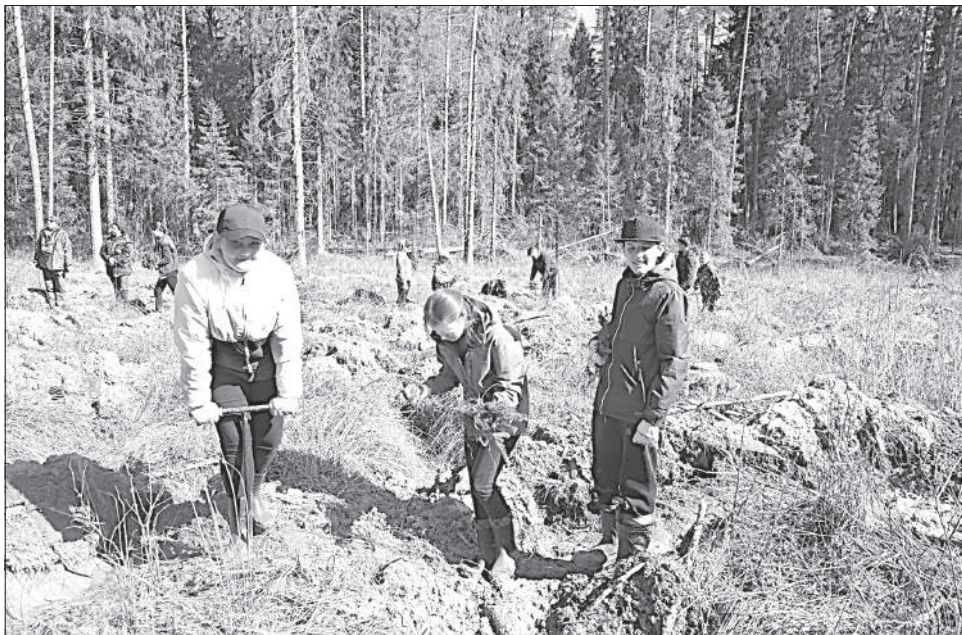
Учащиеся рассыпались по вспаханым лесным грядкам