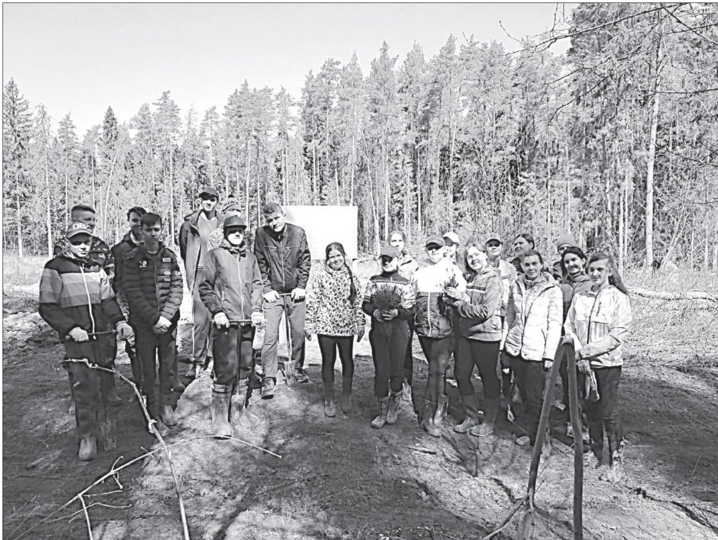
Группа волонтеров МБОУ СОШ №6